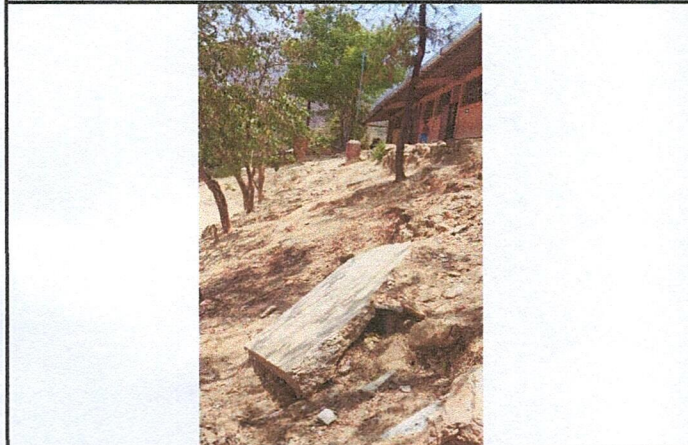
Foto 3: Area donde se contempla hacer el mejoramiento de cerramiento de muro perimetral.