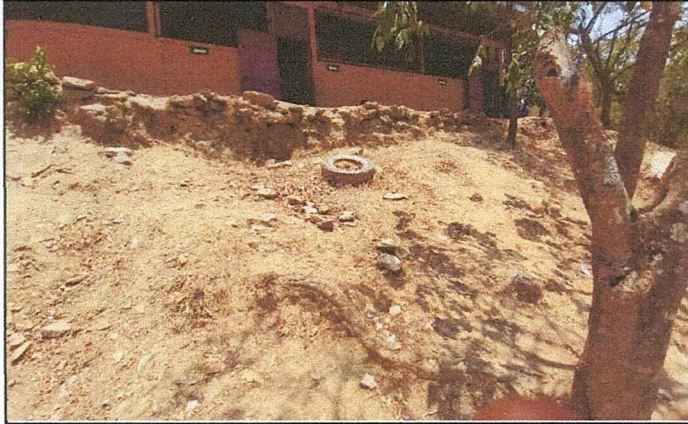
Foto 1: Area donde se contempla hacer el mejoramiento de cerramiento de muro perimetral