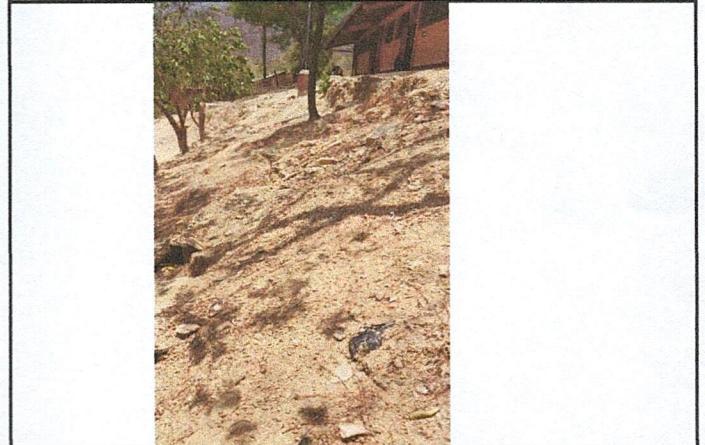
Foto 4: Area donde se contempla hacer el mejoramiento de cerramiento de muro perimetral.

Observación: Si es necesario se pueden agregar hojas adicionales y actualizar el número de hojas.